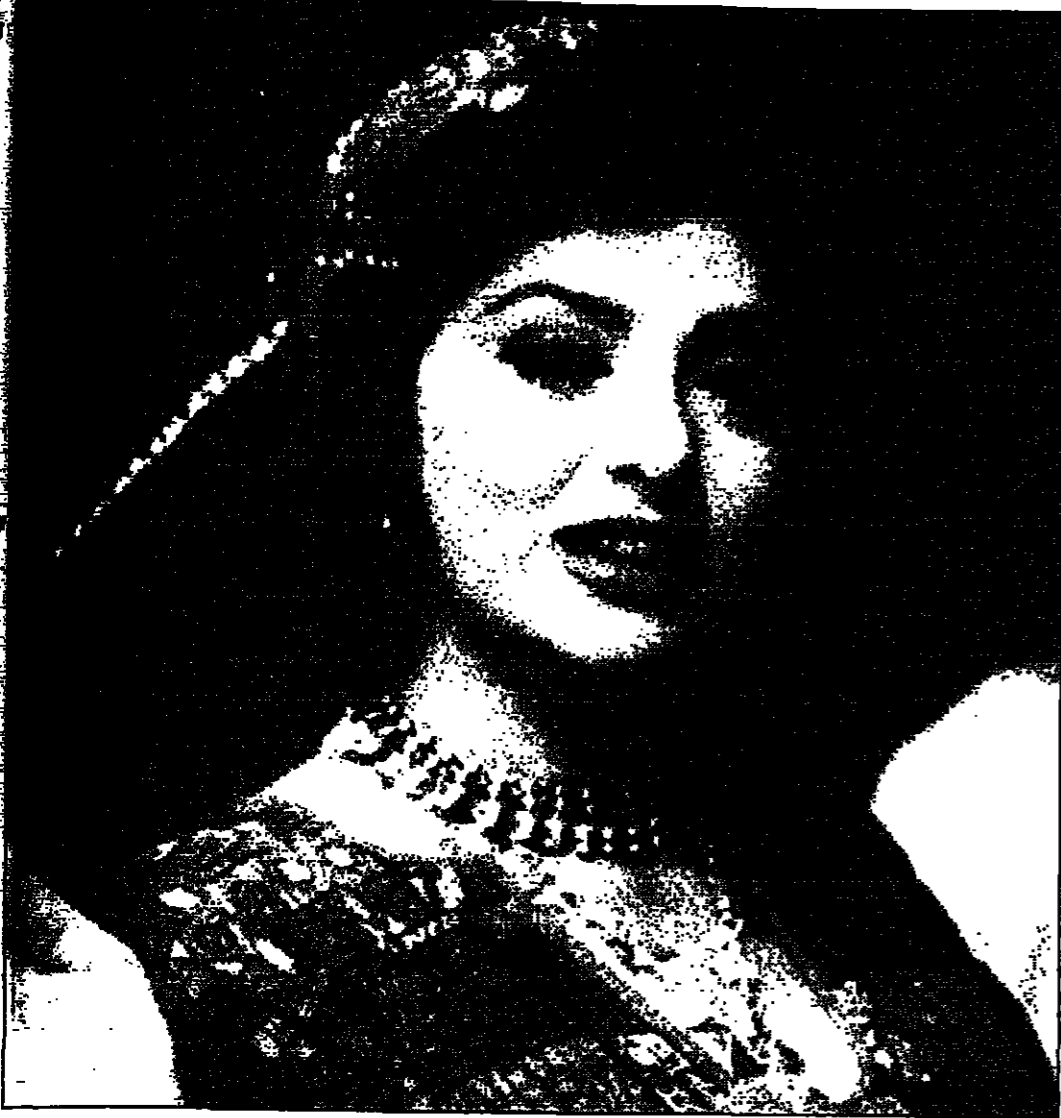
نبيلة عبيد (القديس العربي)